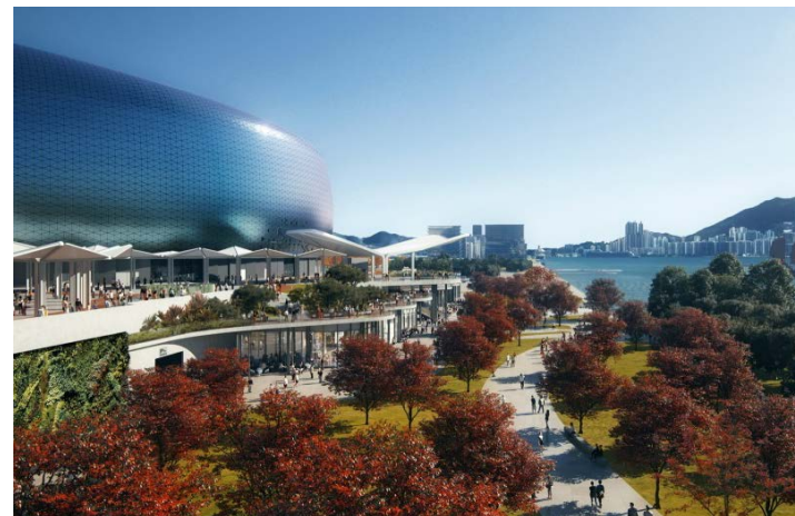
位於海濱長廊的美食海灣