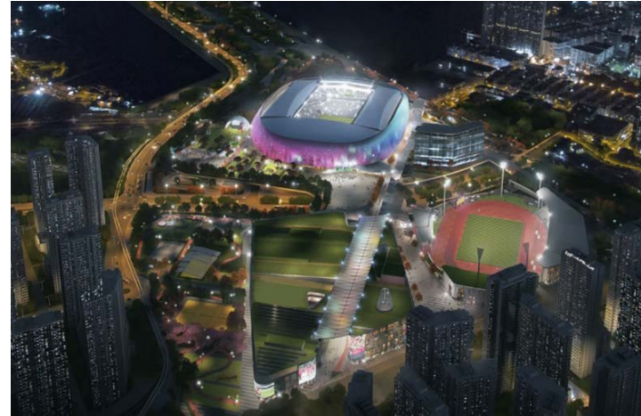
全景圖 - 夜間