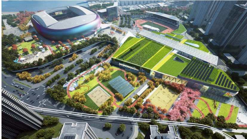
全景圖 - 日間