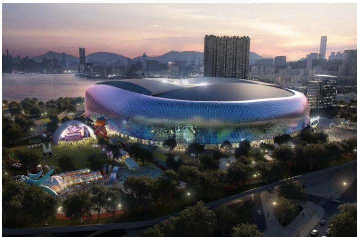
主場館 - 外部景觀