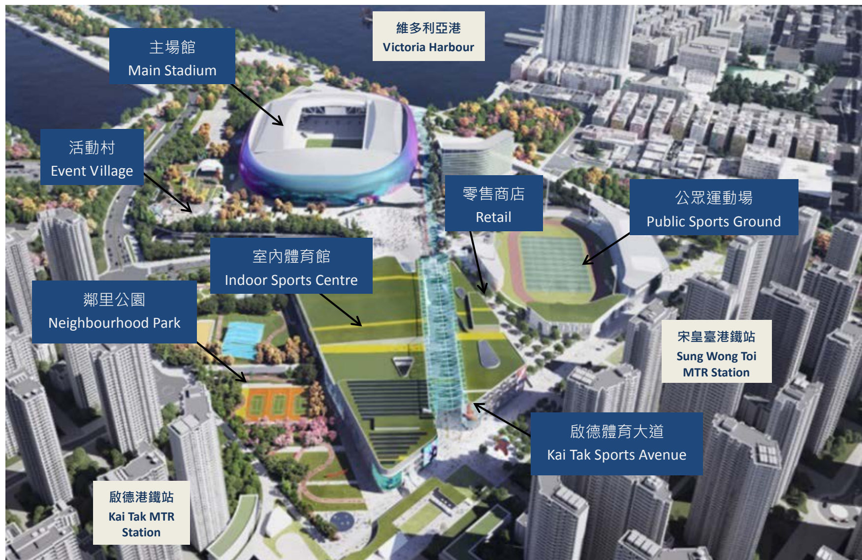
啟德體育園的總綱發展藍圖