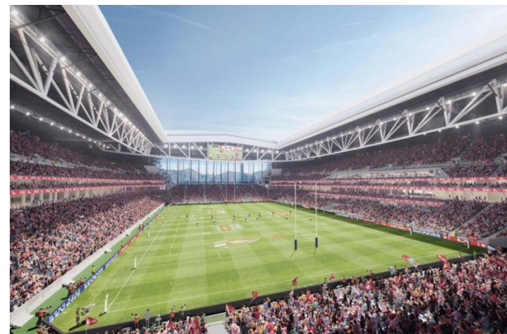
主場館 - 內部景觀